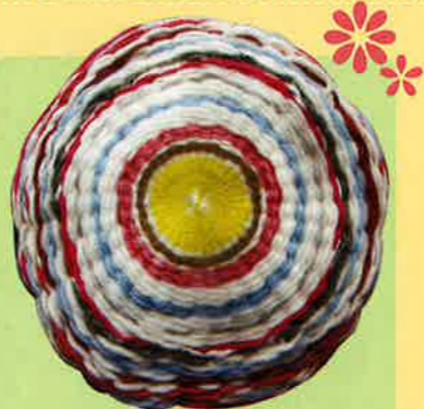
丸椅子カバー 1枚 500円 税込