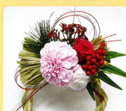
サボンドフルール アレンジメント 1個 2,500円 税込

自主制作品の販売(知育絵本・ピアス・カバンなど) 企業からの請負作業 (お骨袋・カードケース・商品の梱包、発送など) 美容室手伝い(清掃作業など)