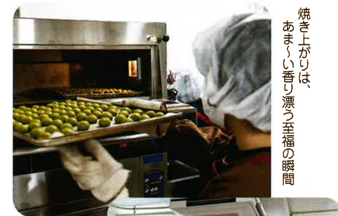
焼き上がりは、あま〜い香り漂う至福の瞬間