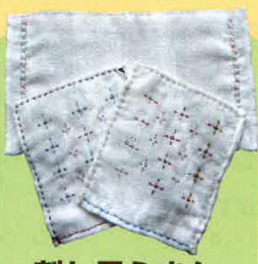
刺し子ふきん (ミトン・パッテン) 1枚 150円 税込