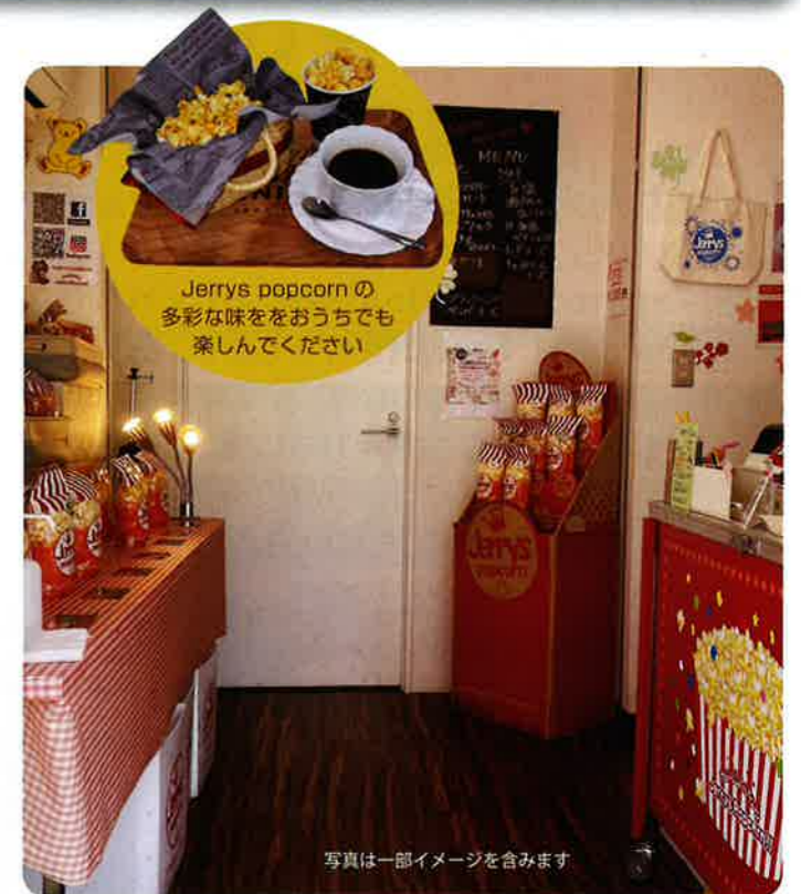
写真は一部イメージを含みます

※配達はお受けしておりませんのでお手数ですが 店舗まで取りに来ていただくようお願いいたします。