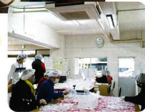
みんなでやりがいを持って楽しく作業

Com bloom は 2015 年 6 月にさまざまな障がいを持っていても笑顔で過ごせる居場所として開所しました。作業や活動を通じて可能性を広げ、得意なことを見つけ、様々な分野で活躍できる支援を行っています。