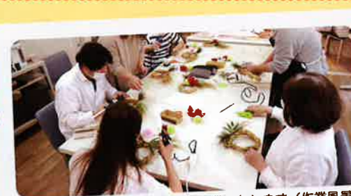
心を込めて作業いたします(作業風景)