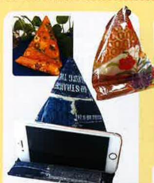
スマホスタンド 1個 500円 税込

自主制作品の販売(知育絵本・ピアス・カバンなど) 企業からの請負作業 (お骨袋・カードケース・商品の梱包、発送など) 美容室手伝い(清掃作業など)