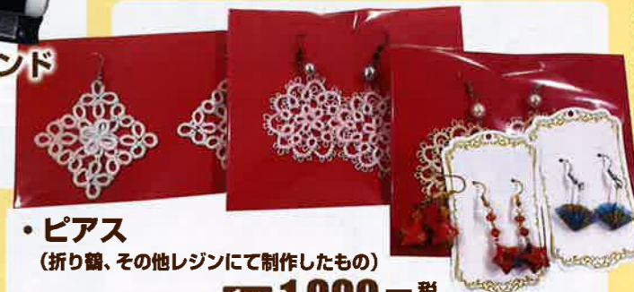
・ピアス (折り鶴、その他レジンにて制作したもの) 1対 1,000円 税込