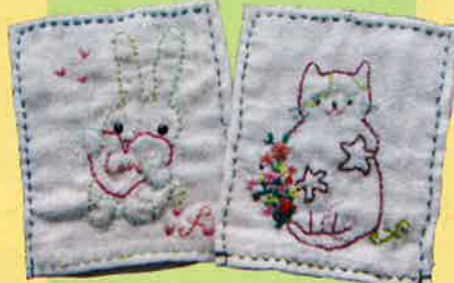
刺し子ふきん (刺繍) 1枚 200円 税込